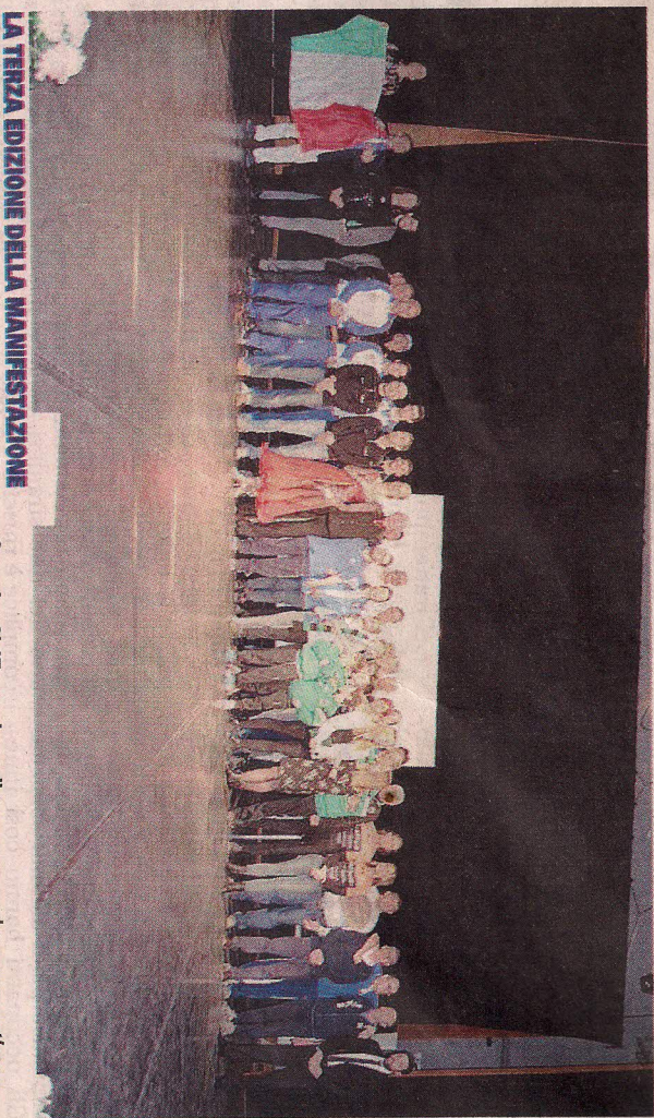
LA TERZA EDIZIONE DELLA MANIFESTAZIONE